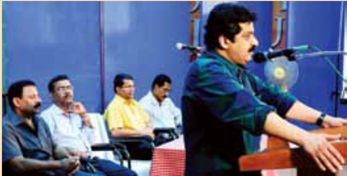
കേരള ലോക്കൽ ഗവൺമെന്റ് സർവീസ് ഡെലിവറി പ്രോജക്ടിന്റെ ആഭിമുഖ്യത്തിൽ തദ്ദേശസ്വയംഭരണ സ്ഥാപനങ്ങളിലെ ജീവനക്കാർക്ക് വേണ്ടിയുള്ള ജില്ലാതല പരിശീലന പരിപാടിയുടെ ഉദ്ഘാടനം പഞ്ചായത്ത് സാമൂഹ്യക്ഷേമ വകുപ്പ് മന്ത്രി ഡോ. എം.കെ. മുനീർ നിർവഹിക്കുന്നു.

കേരള ലോക്കൽ ഗവൺമെന്റ് സർവീസ് ഡെലിവറി പ്രോജക്ടിന്റെ (കെ.എൽ.ജി.എസ്.ഡി.പി) ആഭിമുഖ്യത്തിൽ സംസ്ഥാനത്തൊട്ടാകെയുള്ള ഗ്രാമ പഞ്ചായത്തുകളിലെയും മുനിസിപ്പാലിറ്റികളിലെയും ജീവനക്കാർക്ക് വേണ്ടിയുള്ള ജില്ലാ തല പരിശീലനപരിപാടിയുടെ ഉദ്ഘാടനം പഞ്ചായത്ത് സാമൂഹ്യക്ഷേമ വകുപ്പ് മന്ത്രി ഡോ. എം.കെ. മുനീർ നിർവഹിച്ചു.