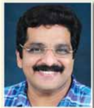
ഡോ. എം.കെ. മുനീർ പഞ്ചായത്ത് സാമൂഹ്യക്ഷേമ വകുപ്പ് മന്ത്രി

രോഗിപരിചരണം എക്കാലത്തും എവിടെയും മനുഷ്യരാശിയുടെ ഉത്തരവാദിത്തങ്ങളിൽ ഒന്നായി പരിഗണിക്കപ്പെട്ടുവരുന്നു. പല രോഗങ്ങളും പ്രത്യേകിച്ച് വാർദ്ധക്യത്തിലെ മാരക അസുഖങ്ങൾ രോഗിയെ തീവ്രവേദനയുടെ ഗർത്തത്തിൽ ആഴ്ത്തുന്നവയാണ്. പ്രായാധിക്യത്തിന്റെ ക്ലേശങ്ങളും സാമൂഹികമായ ഒറ്റപ്പെടലും കൂടി രോഗത്തോടൊപ്പം ചേരുമ്പോൾ ആതുരത ഇരട്ടിക്കുന്നു. ക്യാൻസർമാതിരിയുള്ള കടുത്ത രോഗങ്ങൾ ബാധിക്കുന്ന കുട്ടികൾക്കുപോലും സാന്ത്വന ചികിത്സ വേണ്ടിവരുന്നു. ചുരുക്കത്തിൽ നമ്മുടെ സമൂഹത്തിലെ വലിയ ഒരു വിഭാഗം ജനത സാന്ത്വന ചികിത്സ തേടുന്നവരാണ്. ആശുപത്രികൾക്ക് മാത്രമായോ കുടുംബാംഗങ്ങൾക്ക് മാത്രമായോ പലപ്പോഴും രോഗി അർഹിക്കുന്ന ചികിത്സയും വേദനയിൽ നിന്ന് മുക്തിയും പലപ്പോഴും നൽകുവാൻ കഴിഞ്ഞത് വരുകയില്ല. സമൂഹത്തിന്റെ മുഴുവൻ ഉത്തരവാദിത്തവും പതിയെ വേഗം മാത്രമേ സാന്ത്വന ചികിത്സസാരംഗം കൂടുതൽ ഫലപ്രദമാകുകയുള്ളൂ. സന്നദ്ധസംഘടനകൾക്ക് ഡോക്ടർമാരുടെ ഉദ്യമങ്ങൾക്ക് പുരകമായി പ്രവർത്തിക്കാൻ കഴിയും. രോഗികളുടെ വേദനയും കഷ്ടപ്പാടും ശമിപ്പിക്കുന്നതിനുള്ള ഈ ചികിത്സാ പദ്ധതിയിൽ തദ്ദേശഭരണ സ്ഥാപനങ്ങൾക്ക് സുപ്രധാനമായ പങ്ക് വഹിക്കാൻ കഴിയും. നാട്ടിലെ ഓരോ പൗരനുമായും നിരന്തരബന്ധം