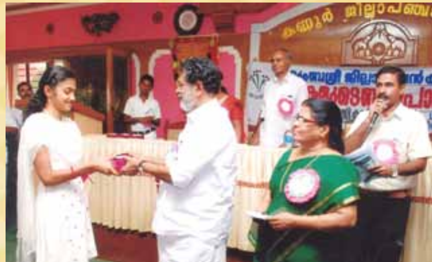
കണ്ണൂർ ജില്ലയിൽ നടന്ന ബാലപാർലമെന്റിൽ പങ്കെടുത്ത കുട്ടികൾക്ക് കേരള നിയമസഭ സ്പീക്കർ ജി. കാർത്തികേയൻ ഉപഹാരം നൽകുന്നു.

കേരളത്തിൽ രക്ഷിതാക്കളിൽ മഹാഭൂരിപക്ഷവും അവരുടെ തീരുമാനങ്ങൾ കുട്ടികളിൽ അടിച്ചേൽപ്പിക്കുകയാണ് പതിവ്. കുട്ടികളെ സംബന്ധിക്കുന്ന തീരുമാനങ്ങളിൽ പോലും കുട്ടികൾ വെറും