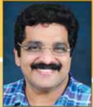
ഡോ. എം.കെ. മുനീർ പഞ്ചായത്ത് സാമൂഹ്യക്ഷേമ വകുപ്പുമന്ത്രി

നാം ഇപ്പോൾ പഞ്ചായത്ത് സുവർണ്ണ ജൂബിലി ആഘോഷിക്കുകയാണ്. തദ്ദേശഭരണ രംഗത്ത് അനവധി പരിണാമങ്ങൾക്ക് സാക്ഷ്യം വഹിച്ച അരനൂറ്റാണ്ടാണ് നാം പിന്നിടുന്നത്. ഇവയിലെ വിപ്ലവകരമായ പരിവർത്തനം അധികാരവികേന്ദ്രീകരണമായിരുന്നു. വികേന്ദ്രീകൃതസുത്രണവും സാമ്പത്തികവികേന്ദ്രീകരണവും ഈ പ്രക്രിയയുടെ ഭാഗമായി. ജനാധിപത്യം അതിന്റെ പൂർണ്ണ അർത്ഥത്തിൽ ശാക്തീകരിക്കപ്പെടുകയും ദുർബലവിഭാഗങ്ങൾ അധികാരശ്രേണിയിൽ തങ്ങളുടെ സ്വന്തം ഇരിപ്പിടം കണ്ടെത്തുകയും ചെയ്തു. രാജ്യത്തെ ഓരോ പൗരന്റെയും ശബ്ദം കേൾക്കപ്പെടുകയും ശ്രദ്ധിക്കപ്പെടുകയും ചെയ്യുന്ന അവസ്ഥയിൽ സ്വന്തം ശബ്ദത്തിന്റെ ശക്തി അവൻ തിരിച്ചറിഞ്ഞു. ത്രിതല പഞ്ചായത്തിരാജ് സംവിധാനം ഏറ്റവും ഫലപ്രദമായി നടപ്പിലാക്കുന്ന സംസ്ഥാനങ്ങളിൽ ഒന്ന് കേരളം ആണെന്നത് നമുക്ക് അഭിമാനം പകരുന്നു. പല വികസന രാജ്യങ്ങളിൽനിന്നും കേരളത്തിന്റെ ഈ വിജയകഥ നേരിൽ മനസ്സിലാക്കാനായി പ്രതിനിധി സംഘങ്ങൾ ഇവിടേക്കെത്തുന്നുണ്ട്. നമ്മുടെ പഞ്ചായത്തിരാജ് സംവിധാനം കേന്ദ്ര ഗവണ്മെന്റിന്റെ പുരസ്കാരങ്ങൾ പല പ്രാവശ്യം നേടി.