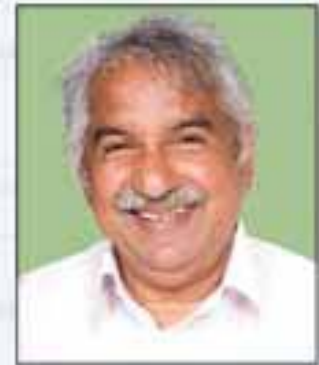
ഉമ്മൻ ചാണ്ടി മുഖ്യമന്ത്രി

ഇന്ത്യയിൽ ത്രിതല പഞ്ചായത്ത് രാജ് സംവിധാനം സാർവത്രികമായത് 73-ാം ഭരണഘടനാ ഭേദഗതിയോടെയാണ്. ഈ ഭേദഗതി പ്രാബല്യത്തിൽ വന്ന 1993 ഏപ്രിൽ 24നെ സ്മരിച്ചുകൊണ്ട് എല്ലാ വർഷവും അന്നേ ദിവസം ദേശീയ പഞ്ചായത്ത് ദിനമായി രാജ്യമെങ്ങും ആചരിച്ചു വരുന്നു. കേരളവും ഈ വർഷം മുതൽ പഞ്ചായത്ത് ദിനം ആഘോഷിക്കുവാൻ തീരുമാനിച്ചിരിക്കുകയാണ്.