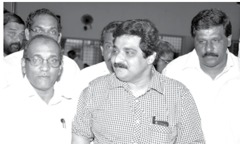
ശേഷം പേജ് 34

പന്ത്രണ്ടാം പദ്ധതിയിൽ ഏറ്റവും കൂടുതൽ പ്രാധാന്യം കാർഷിക മേഖലയ്ക്കാണ് ചടങ്ങിൽ ആശംസകൾ അർപ്പിച്ച കൃഷിവകുപ്പ് മന്ത്രി കെ.പി. മോഹനൻ അഭിപ്രായപ്പെട്ടു. കാർഷിക