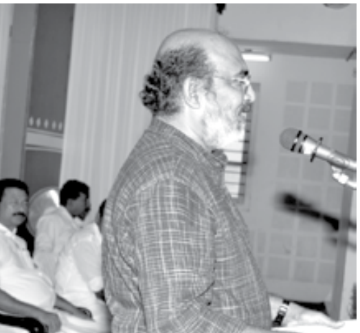
ഡോ. റ്റി.എം. തോമസ് ഐസക് എം.എൽ.എ. മുഖ്യപ്രഭാഷണം നടത്തുന്നു.

വലിയ പ്രശ്നം മാലിന്യ കൃന്മാമാണ്. പട്ടണങ്ങളിൽ മാത്രമല്ല ഗ്രാമങ്ങളിൽ പോലും ഇന്ന് അതൊരു പ്രശ്നമായിരിക്കുകയാണ്. ഇതിന് പരിഹാരം ഉണ്ടാക്കിയില്ലെങ്കിൽ നമ്മൾ നേടുന്ന നേട്ടങ്ങൾക്കൊന്നും പ്രയോജനം ഉണ്ടാവുകയില്ല. ഒക്ടോബർ 2 മുതൽ മാലിന്യമുക്ത കേരളത്തിന് വേണ്ടി സമഗ്രമായ പരിപാടി ആവിഷ്കരിച്ചിരിക്കുകയാണ്. പഞ്ചായത്തുകൾ ഒറ്റക്കെട്ടായി മുന്നോട്ടു വന്ന് പരിപാടി വിജയിപ്പിക്കുവാൻ മുഖ്യമന്ത്രി ആഹ്വാനം ചെയ്തു.