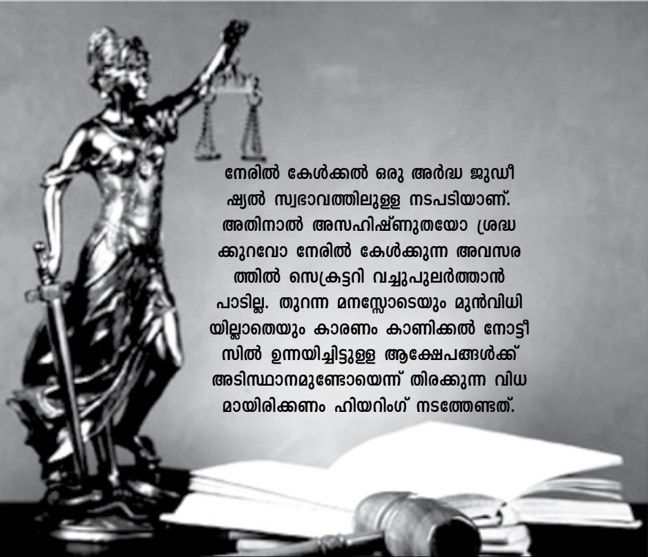
നേരിൽ കേൾക്കൽ ഒരു അർദ്ധ ജൂഡീഷ്യൽ സ്വഭാവത്തിലുള്ള നടപടിയാണ്. അതിനാൽ അസഹിഷ്ണുതയോ ശ്രദ്ധ കുറവോ നേരിൽ കേൾക്കുന്ന അവസരത്തിൽ സെക്രട്ടറി വച്ചുപുലർത്താൻ പാടില്ല. തുറന്ന മനസ്സോടെയും മുൻവിധിയില്ലാതെയും കാരണം കാണിക്കൽ നോട്ടീസിൽ ഉന്നയിച്ചിട്ടുള്ള ആക്ഷേപങ്ങൾക്ക് അടിസ്ഥാനമുണ്ടോയെന്ന് തിരക്കുന്ന വിധമായിരിക്കണം ഹിയറിംഗ് നടത്തേണ്ടത്.