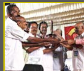
ചെറിയനാടിന് സ്വരാജ് ട്രോഫി