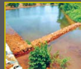
ദിശാബോധം നൽകുന്ന നീർത്തട പദ്ധതികൾ