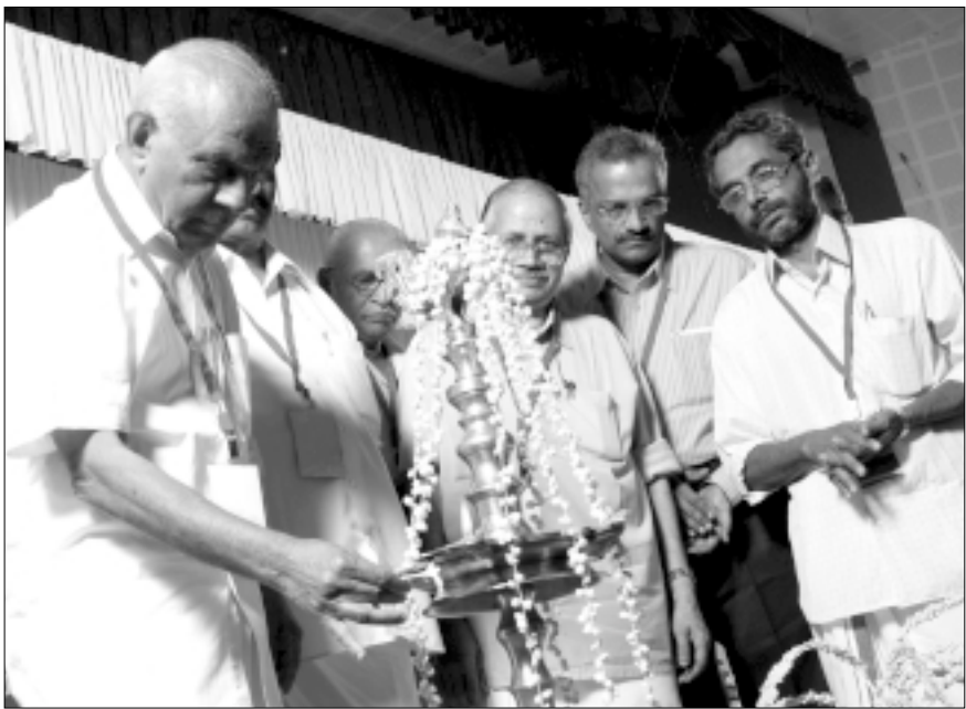
തൃശൂരിൽ വച്ചു നടന്ന പഞ്ചായത്ത് ദിനാഘോഷം തദ്ദേശസ്വയംഭരണ വകുപ്പ് മന്ത്രി പാലോളി മുഹമ്മദ്കുട്ടി ഉദ്ഘാടനം ചെയ്യുന്നു.