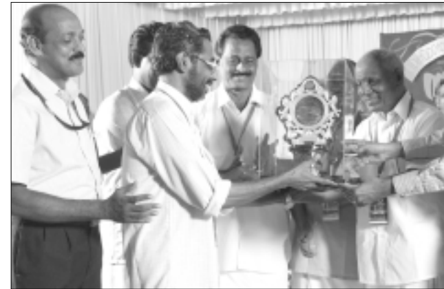
കൊല്ലം ജില്ല : ഒന്നാം സ്ഥാനം - നെടുമ്പന ഗ്രാമ പഞ്ചായത്ത്