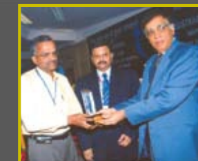
ജനന-മരണ രജിസ്ട്രേഷൻ കേരളത്തിന് ഒന്നാം സ്ഥാനം