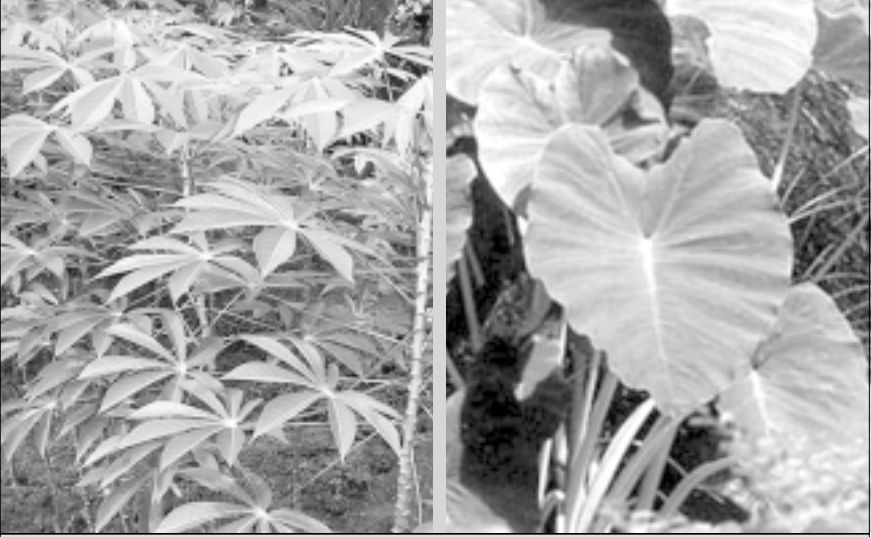
തേഞ്ഞു മാഞ്ഞു പോകുന്ന ഗ്രാമീണ മൊഴിമുത്തുകൾ പരമ്പര - 5