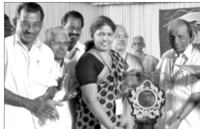
ജില്ലാ പഞ്ചായത്ത് - ഒന്നാം സ്ഥാനം : പാലക്കാട്