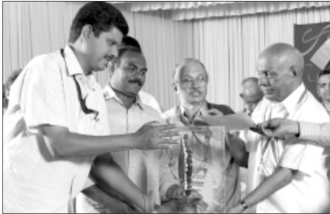
ബ്ലോക്ക് പഞ്ചായത്ത് : രണ്ടാം സ്ഥാനം - ചിറ്റുമല (കൊല്ലം ജില്ല)