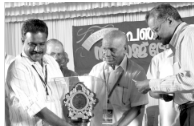
പാലക്കാട് ജില്ല : ഒന്നാം സ്ഥാനം - തച്ചമ്പാറ ഗ്രാമ പഞ്ചായത്ത്