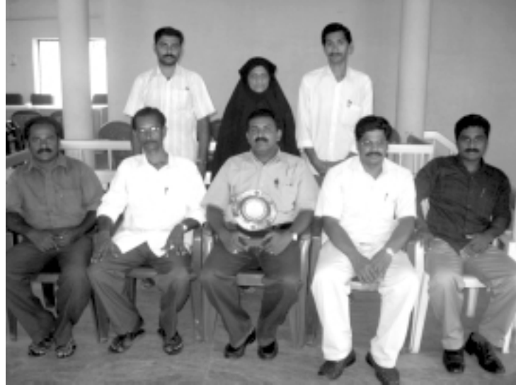
നെല്ലനാട് പെർഫോമൻസ് ഓഡിറ്റ് യൂണിറ്റ് അംഗങ്ങൾ.

പഞ്ചായത്തു ജനപ്രതിനിധികൾക്കും ജീവനക്കാർക്കും യൂണിറ്റിലെ മുഴുവൻ ഉദ്യോഗസ്ഥരുമായി ബന്ധപ്പെടുന്നതിനുള്ള സംവിധാനം നിലനിർത്തുകയും സംശയനിവാരണം നടത്തുകയും വഴി ഒരു ഹെൽപ്പ്ലൈനായി പ്രവർത്തിക്കുവാൻ കഴിഞ്ഞിട്ടുണ്ട്.