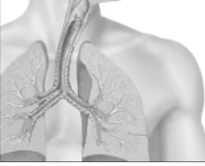
ആശുപത്രിയിൽ അഭയംപ്രാപിക്കേണ്ടി വരുന്നു.

അലർജിക്ക് ആദാരമായ വസ്തുക്കളാണ് ആസ്തമയ്ക്ക് പ്രധാന കാരണം.