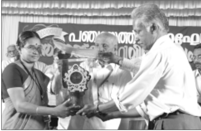
കോഴിക്കോട് ജില്ല : രണ്ടാം സ്ഥാനം - കുറ്റാടി ഗ്രാമ പഞ്ചായത്ത്