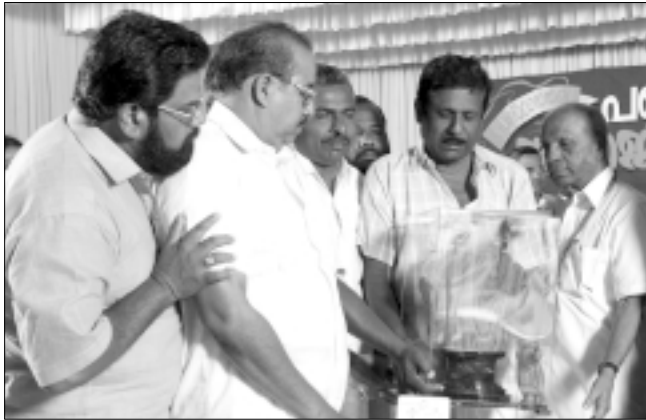
ബ്ലോക്ക് പഞ്ചായത്ത് : ഒന്നാം സ്ഥാനം - മുല്ലശ്ശേരി (തൃശൂർ ജില്ല)