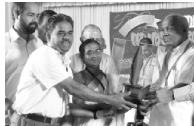
കണ്ണൂർ ജില്ല : ഒന്നാം സ്ഥാനം - മങ്ങാട്ടിടം ഗ്രാമ പഞ്ചായത്ത്

തൃശ്ശൂർ ജില്ലയിലെ മുല്ലശ്ശേരി ബ്ലോക്കും രണ്ടാം സ്ഥാനം കൊല്ലം ജില്ലയിലെ ചിറ്റുമല ബ്ലോക്കും മൂന്നാം സ്ഥാനം ആലപ്പുഴ ജില്ലയിലെ ചെങ്ങന്നൂർ ബ്ലോക്കും നേടി.