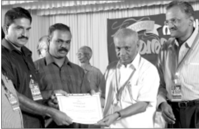
ജില്ലാ പഞ്ചായത്ത് : രണ്ടാം സ്ഥാനം - ആലപ്പുഴ