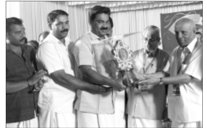
തൃശ്ശൂർ ജില്ല : ഒന്നാം സ്ഥാനം - അടാട്ട് ഗ്രാമ പഞ്ചായത്ത്