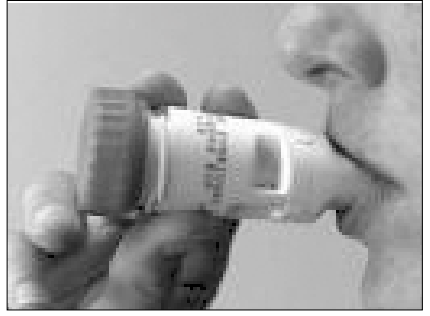
പഞ്ചായത്ത് രാജ് മാർച്ച് 2009

അടിക്കടിയുണ്ടാകുന്ന ആസ്തമ മരുന്നുകൾ കഴിക്കുന്നതോടെ പൂർണ്ണശമനം ഉണ്ടാകുന്നു. വീണ്ടും തണുപ്പിക്കുമ്പോഴോ ചുമയുണ്ടാകുമ്പോഴോ ആസ്തമ ഉണ്ടാകും. വല്ലപ്പോഴുമുണ്ടാകുന്ന ആസ്തമ മരുന്നുകൾ കഴിക്കുമ്പോൾ ഭേദമാകും. ഗുരുതരമായ ആസ്തമയിൽ സാധാരണ ഉപയോഗിക്കുന്ന മരുന്നുകൾ ഫലപ്രദമാകാതെ