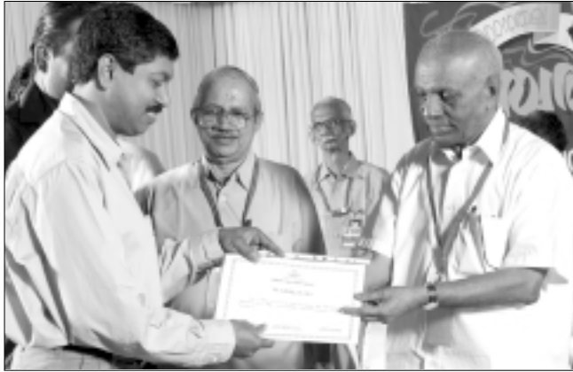
ജില്ലാ പഞ്ചായത്ത് : മൂന്നാം സ്ഥാനം - തിരുവനന്തപുരം

കമ്മിറ്റിയാണു മികച്ച പഞ്ചായത്തുകളെ തിരഞ്ഞെടുത്തത്. ചെറിയനാടിന്റെ സവിശേഷതകൾ ➤ 2006-07 വർഷം വികസന ഫണ്ടിന്റെ 97% ചെലവഴിച്ചു. ➤ നികുതി പിരിവിൽ 100% കൈവരിച്ചു. ➤ 4 ഗ്രാമസഭകൾ വീതം ഓരോ വാർഡിലും ചേർന്നു. ➤ മെയിന്റനൻസ് ഗ്രാന്റ് 100% ചെലവഴിച്ചു. ➤ 2005-06 വരെയുള്ള വാർഷിക ധനകാര്യ സ്റ്റേറ്റ്മെന്റ് ഓഡിറ്റിന് നൽകി.