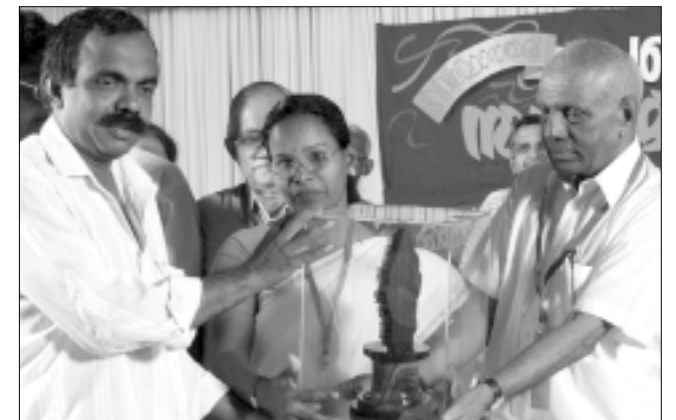
തൃശ്ശൂർ ജില്ല : രണ്ടാം സ്ഥാനം - വേളൂക്കര ഗ്രാമ പഞ്ചായത്ത്

ഏറ്റവും മികച്ച ജില്ല പഞ്ചായത്തിനുള്ള ഒന്നാം സ്ഥാനം പാല