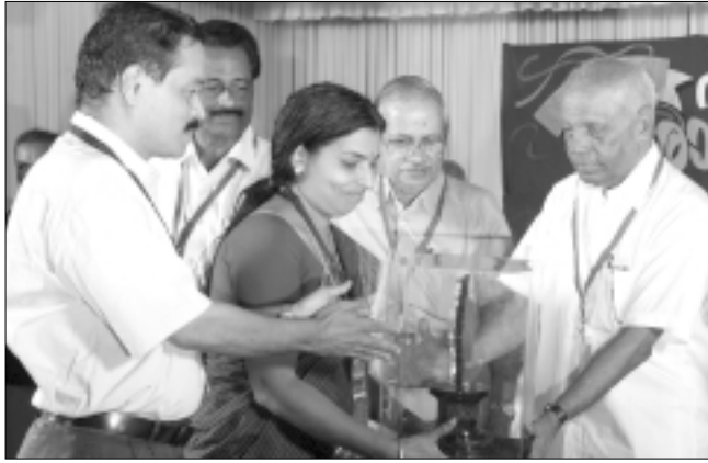
കണ്ണൂർ ജില്ല : രണ്ടാം സ്ഥാനം - ചെമ്പിലോട് ഗ്രാമ പഞ്ചായത്ത്