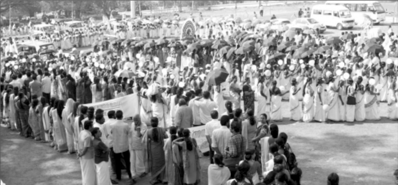
ഘോഷയാത്രയിൽ പങ്കെടുക്കാതെത്തീയ കുടുംബശ്രീ പ്രവർത്തകർ.