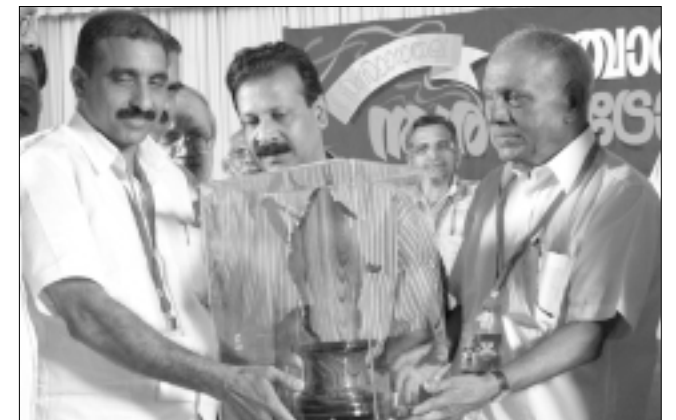
കോഴിക്കോട് ജില്ല : ഒന്നാം സ്ഥാനം - നാദാപുരം ഗ്രാമ പഞ്ചായത്ത്