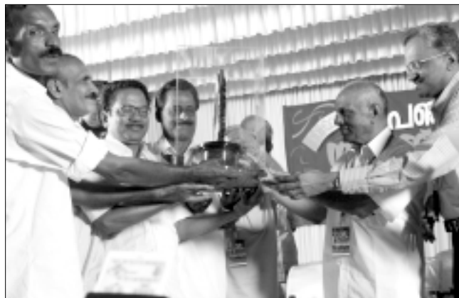
സംസ്ഥാന തലത്തിൽ ഒന്നാം സ്ഥാനം : ചെറിയനാട് ഗ്രാമപഞ്ചായത്ത്

മികച്ച ബ്ലോക്ക് പഞ്ചായത്തുകൾക്കുള്ള ഒന്നാം സ്ഥാനം